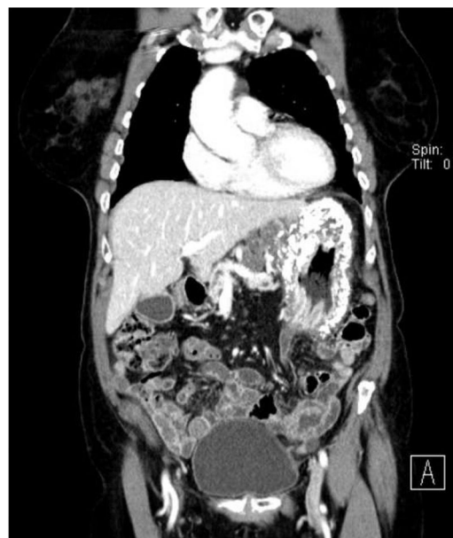
Figura 1 Corte coronal. Se observa la calcificación difusa de todo el estómago.

Dado que la paciente presentaba afectación ganglionar, se decidió realizar inicialmente tratamiento neoadyuvante.