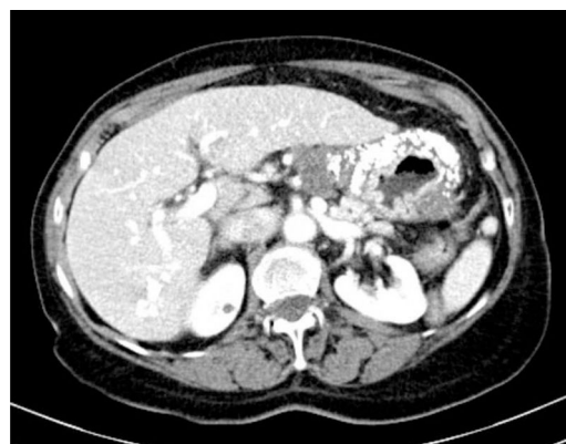
Figura 2 Corte transversal donde se evidencia la pared gástrica engrosada y calcificada.

Tras 4 ciclos de tratamiento quimioterápico, la TC de control evidenció importante progresión de la enfermedad, con metástasis ovárica y carcinomatosis peritoneal, desestimándose la cirugía. En cuanto a las calcificaciones, estas no