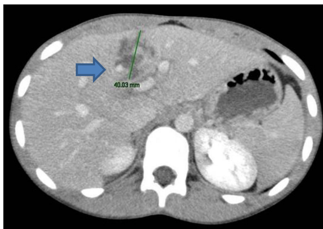
Figura 1 Corte axial (TAC) donde se evidencia laceración de 4 cm en el parénquima del segmento IVb.

El paciente ingresa en la unidad de cuidados intensivos, donde permanece durante 3 días, manteniéndose hemodinámicamente estable en todo momento, sin necesidad de transfusión de hemoconcentrados o de fármacos vasopresores, con buena evolución clínica y estabilidad de los parámetros analíticos. Se decide su traslado a planta, donde