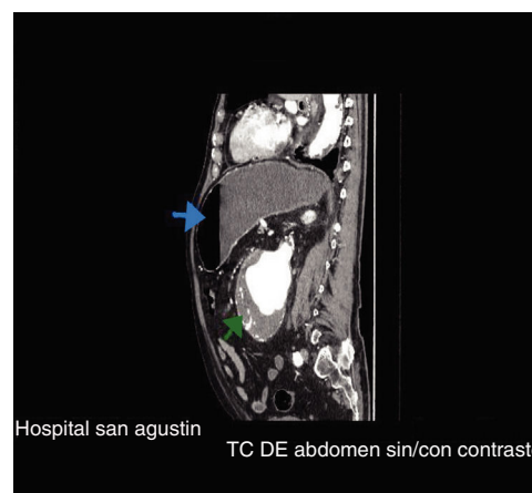
Figura 1 Estómago de retención y aneurisma.

Varón de 89 años que acude a urgencias por vómitos alimenticios, dolor y distensión abdominal de 12 h de evolución, apreciándose en la exploración una masa pulsátil abdominal. Se realiza una TC en la que se objetiva un estómago de retención (fig. 1, flecha azul) secundario a compresión duodenal por un gran aneurisma de aorta abdominal (figs. 1 y 2, flecha verde), observándose un duodeno filiforme (fig. 2, flecha roja) con dilatación de asas proximales y normalización del calibre distal al aneurisma. La compresión duodenal por un aneurisma de aorta abdominal recibe el nombre de síndrome aortoduodenal. Es una entidad muy infrecuente que suele cursar con vómitos, pérdida de peso y dolor, y distensión abdominal, y debe sospecharse ante la aparición de sintomatología obstructiva y la existencia de una masa pulsátil abdominal. La TC abdominal con contraste permite confirmar el diagnóstico y excluir otras causas. El tratamiento se basa en una estabilización inicial con soporte hidroelectrolítico y descompresión gástrica para realizar posteriormente una cirugía electiva.