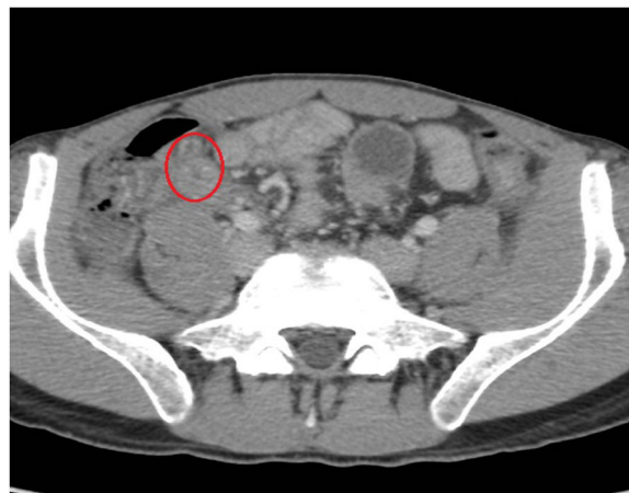
Figura 1 Imagen de la TAC.

Varón de 27 años que acudió a urgencias por dolor abdominal epigástrico irradiado a fosa ilíaca derecha, de 24 h de evolución, con signo de Blumberg positivo en la exploración, y leucocitosis con neutrofilia en la analítica. Se realizó TC abdominal donde se apreció un apéndice en situación postileal con paredes engrosadas en las que se identifican pequeños divertículos (fig. 1, círculo rojo), con cambios inflamatorios en la grasa periapendicular y pequeña cantidad de líquido, alteraciones compatibles con diverticulitis apendicular asociada a apendicitis aguda. Se realizó apendicectomía, confirmándose en el estudio anatomopatológico la existencia de múltiples divertículos con microperforación de uno de ellos en tercio proximal (fig. 2, flecha amarilla). La diverticulitis apendicular es una causa infrecuente de abdomen agudo, clínicamente indistinguible de la apendicitis aguda, si bien en ocasiones puede tener un curso más indolente, y presenta ciertos aspectos tanto epidemiológicos como evolutivos que pueden permitir considerarla una entidad diferenciada. Aunque la imagen por TC puede ser