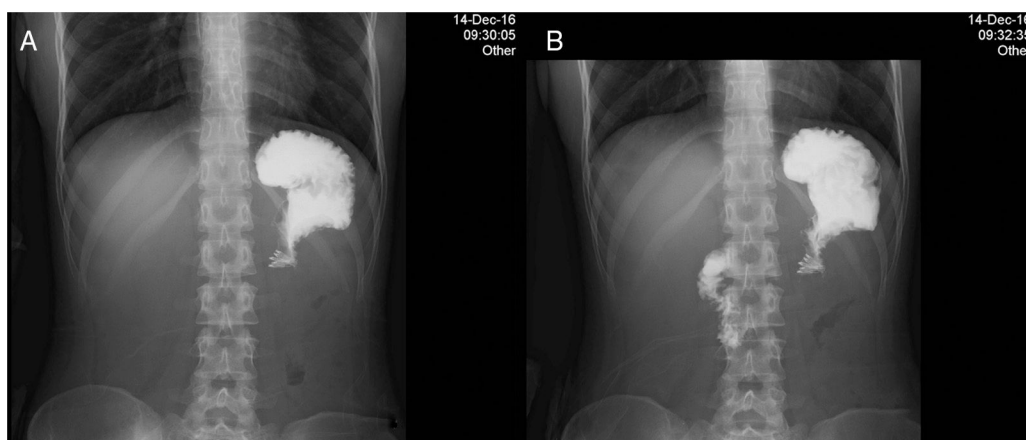
Figura 2 Tránsito intestinal con material hidrosoluble a las 24 h posteriores al procedimiento. A) Inicio del paso del material hidrosoluble, no observando ninguna fuga de medio. B) Antes de los 2 min, se observa un adecuado paso hacia el duodeno.

control demuestra un retardo en el vaciamiento de 8% a los 240 min.