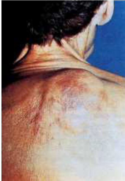
Figura 1. Lesión dorsal.