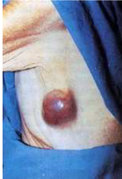
Figura 2. Lesión axilar.