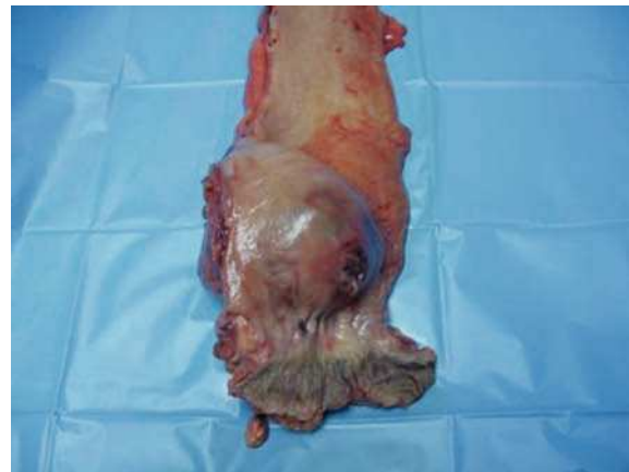
■ Figura 1. Apertura de la pieza de la resección abdominoperineal en la que se observa una tumoración que abomba la mucosa con una ulceración en su vértice.