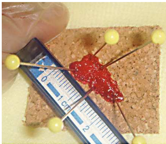
■ Figura 5. Pieza quirúrgica.

se realizó la dissección endoscópica de la submucosa, con navaja de punta aislada “ IT2-knife ” (Figuras 3 y 4). Durante el procedimiento, presentó sangrado abundante y alteraciones electrocardiográficas que no impidieron concluir el estudio. Después de 180 minutos, se obtuvo una pieza de 2 cm por 1 cm (Figura 5). Egresó luego de 48 horas de vigilancia hospitalaria, estable y en buenas condiciones.