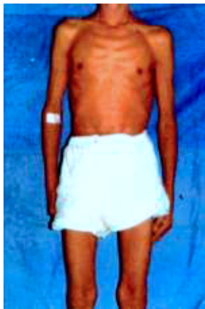
Figura 1. Paciente con fasciolosis hepática, que presenta pérdida de 24 kilogramos de peso.