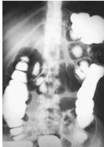
Figura 2. Colon por enema de un paciente con síndrome de intestino irritable con predominio de estreñimiento.