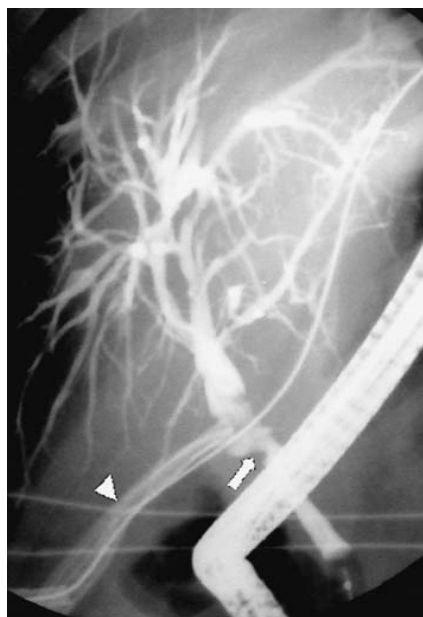
Figura 2. Colangiografía retrógrada endoscópica que muestra obstrucción parcial del conducto biliar principal (flecha), que perpetuo una fístula biliar, la cual se controló con sistema de drenaje cerrado (cabeza de flecha).

ocasiones en el Servicio de Urgencias por cuadros de colangitis y hemorragia de tubo digestivo. Se realizan cambios periódicos de endoprótesis y aún se observa la estenosis.