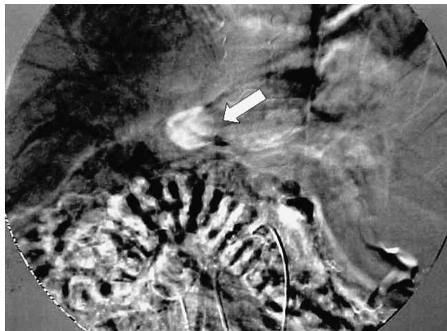
Figura 1. Angiografía que muestra en fase venosa una importante concentración de medio de contraste en la región del hilio hepático (flecha), condicionada por la presencia de várices pericoledocianas.

Masculino de 28 años de edad con antecedente de transfusiones a los 18 meses (desconoce indicación) y 17 años por hemorragia de tubo digestivo alto. A los 24 años acude a valoración al Instituto por presentar evacuaciones melénicas en múltiples ocasiones. Una endoscopia mostró várices esofágicas grados III-IV con datos de mal pronóstico y gastropatía congestiva, la angiografía detectó trombosis de la vena porta y degeneración cavernomatosa ( Figura 1 ); en los siguientes cuatro meses se le realizaron los tiempos abdominal y torácico de la operación de Sugiura. Un año después, una endoscopia mostró várices esofágicas grado I; además, se confirmó síndrome antifosfolípido e inició tratamiento con acenocumarina. A los 26 años presentó ictericia obstructiva, la colangiorresonancia y colangiografía retrógrada mostraron una estenosis a nivel del colédoco intrapancreático y datos importantes de gastropatía congestiva. Se realizó esfinterotomía y colocación de endoprótesis, en los siguientes meses se llevó a cabo colecistectomía por agudización de colecistitis crónica litiásica y en las colangiografías de control se mostró una fístula a cavidad abdominal a nivel del conducto cístico, que se manejó satisfactoriamente con la endoprótesis y la fístula desapareció en los estudios de control. A tres años de seguimiento el paciente se ha presentado en múltiples