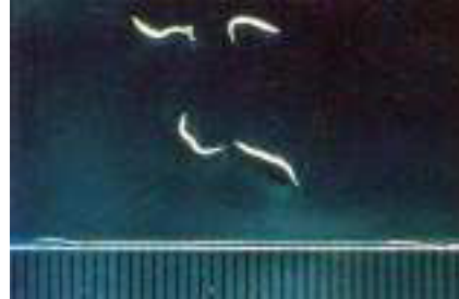
Figura 2. Las hembras miden de ocho a 13 mm de longitud en forma de un alfiler y los extremos puntiagudos.