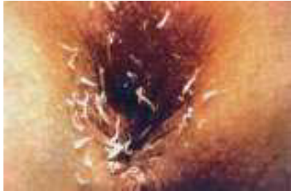
Figura 1. Región perianal con abundantes gusanillos blanquecinos.