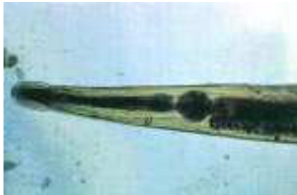
Figura 3. La extremidad anterior del parásito termina en dos prolongaciones cuticulares y el esófago está muy desarrollado.