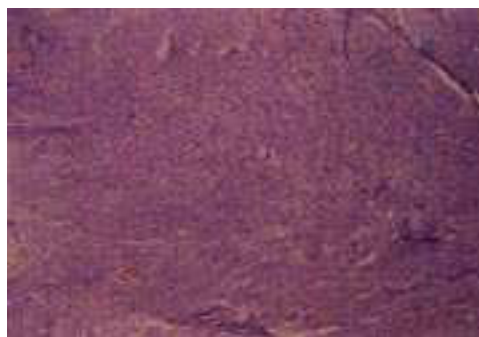
Figura 3. Tinción PAS.