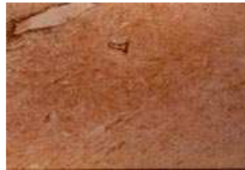
Figura 5. Tinción actina.

Paciente femenina de 58 años de edad con antecedentes de ser portadora de hipertensión arterial. Histerectomía abdominal por miomatosis. Acude con historia de hemorragia de tubo digestivo bajo en tres ocasiones con un año de evolución, hematoquezia, tratada inicialmente de manera conservadora. En el tercer episodio de hemorragia se inicia protocolo de estudio para la hemorragia de tubo digestivo. Es estabilizada y se realiza endoscopia gastroduodenal, así como colonoscopia, sin lograr identificar sitio de hemorragia. Se solicita gammagrafía con eritrocitos marcados con Tc99 ( Figura 1 ), presentándose lesión móvil, y con pedículo de origen aparente en la arteria iliaca común. Por la evidencia clínica, y por presentarse su tercer episodio de hemorragia, se somete a laparotomía exploradora encontrando tumor de 10 cm de diámetro, dependiente de íleon, a 90 cm de la válvula ileocecal ( Figura 2 ). Se realiza resección del tumor y anastomosis termino-terminal. Su evolución posquirúrgica fue adecuada con ingesta de dieta completa al tercer día y alta hospitalaria el cuarto día. El estudio histopatológico, mediante tinciones de H-E, PAS ( Figura 3 ), CD 117 ( Figura 4 ) y actina ( Figura 5 ), demostrándose tumor estromal con comportamiento biológico benigno.