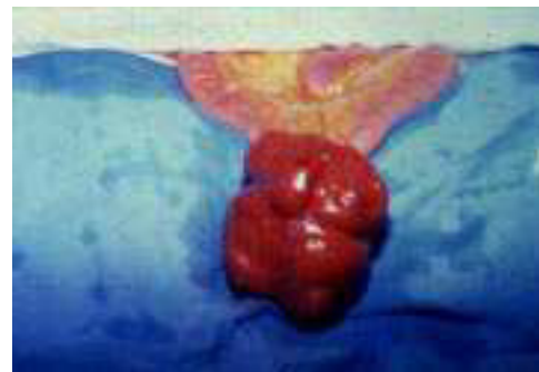
Figura 2. Tumor estromal ileon transoperatorio.