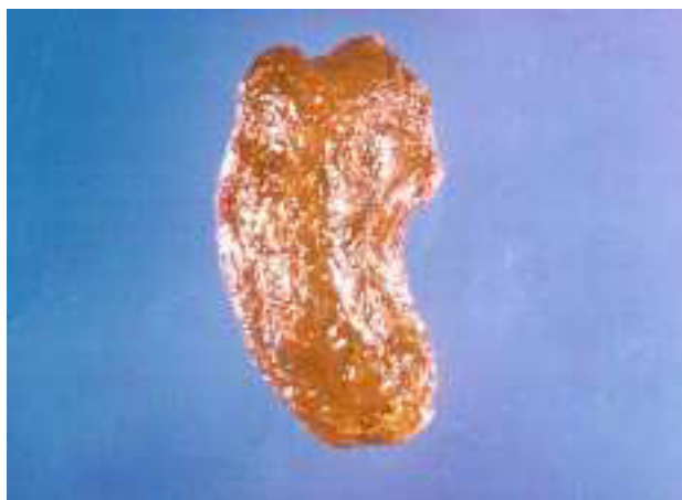
Figura 2. Trombo de hepatocarcinoma en vía biliar común a nivel de la bifurcación de los conductos hepáticos.