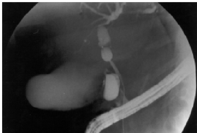
Figura 2. Se observa importante fuga de material de contraste a nivel de la vía biliar proximal.