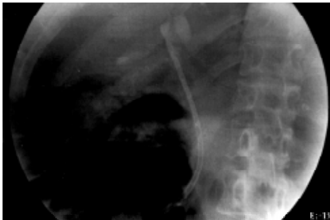
Figura 3. La endoprótesis biliar se ha colocado y se identifica extremo distal en la porción intrahepática. El vaciamiento del contraste se lleva a cabo sin dificultad.