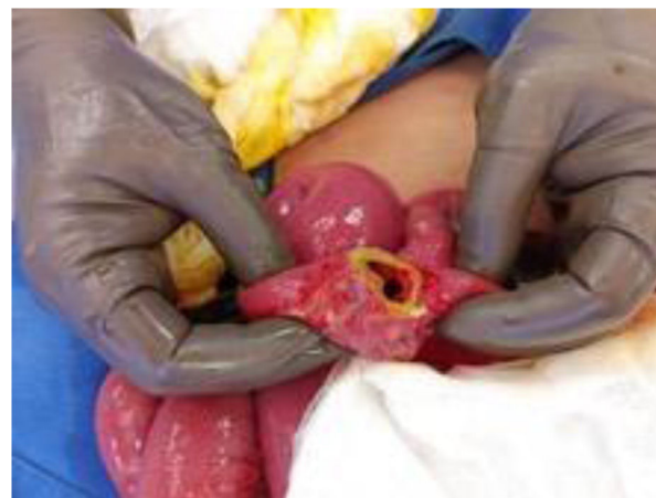
Figura 1 Perforación en yeyuno a 60 cm de ángulo de Treitz.

Inició padecimiento en noviembre de 2021, presentando astenia, adinamia, tos productiva, emetizante, disneizante, no cianosante, sintomatología que persistió durante 21 días. Además, presentó disnea de pequeños y medianos esfuerzos y polipnea. Después de los 14 días del inicio de los síntomas, presentó expectoración con hemoptóicos, y alza térmica acompañada de la presencia de escalofríos, piloerección y diaforesis, por lo que acudió a valoración médica al servicio de Urgencias de nuestro Hospital. El paciente fue valorado e ingresado por el servicio de Medicina Interna el 11 de noviembre de 2021, con diagnóstico de neumonía en paciente inmunocomprometido. Debido a ello, se inició TAR con tenofovir/emtricitabina (1 tableta cada 24 horas lopinavir/ritonavir 2 tabletas vía oral cada 12 horas, en conjunto con trimetoprima-sulfametoxazol y ceftriaxona). Alrededor de dos semanas posteriores al inicio del tratamiento, comenzó con dolor abdominal localizado en fosa iliaca izquierda con una intensidad 7/10 intermitente, tipo cólico, acompañado de náuseas sin llegar al vómito. A la exploración física presentaba dolor abdominal, suave a la palpación, dolor de rebote y rigidez de la pared abdominal, con hallazgo de aire libre subdiafragmático en radiografía de tórax. Se identificó neumoperitoneo en recesos