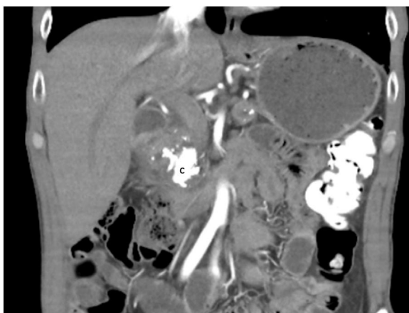
Figura 1 Tomografía computarizada que evidencia calcificaciones (C) a nivel de la cabeza del páncreas. Paciente inicialmente manejado con cirugía (pancreatoduodenectomía).