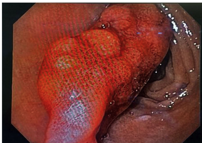
Figura 1 Esofagogastroduodenoscopia; se observa pólipo pediculado en bulbo duodenal, aproximadamente de 4 cm de diámetro en la primer porción del duodeno con datos de sangrado activo.