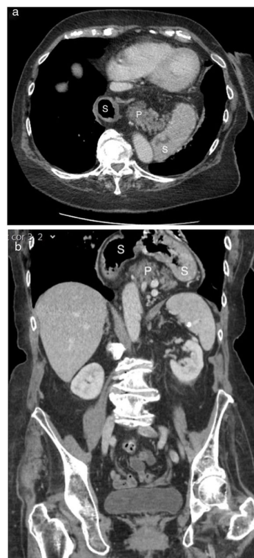
Figura 1 Imágenes de TC del páncreas intratorácico. Imagen de TC axial (a) y coronal (b) donde se muestra la hernia total de estómago (S), asociada con un páncreas casi completamente herniado (P).

La hernia de páncreas en la cavidad torácica es extremadamente inusual 1 . Este es un hallazgo importante al cual se le debe dar seguimiento cercano dado que eventualmente podría llevar a pancreatitis, debida a la obstrucción del conducto pancreático 2 . Nuestra paciente no presentó signos de pancreatitis, pero sus molestias se han incrementado gradualmente durante las pasadas semanas, por lo que ha sido programada para reparación laparoscópica de hernia hial.