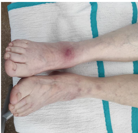
Figura 1 Lesiones subcutáneas nodulares eritematovioláceas, no ulceradas, en miembros inferiores.

Mujer de 83 años ingresada por pancreatitis aguda tras consultar por epigastralgia e hiperamilasemia (13,370 U/l; rango normal 20-120). Dos días después presenta nódulos