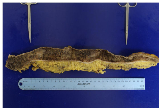
Figura 2 Colon macroscópico diseccionado. Ambas estenosis están indicadas por los forceps de metal en el colon transverso y descendente respectivamente.

recolección tres-cuatro veces por día, tolera una dieta normal y ha tenido una recuperación de peso adecuada.