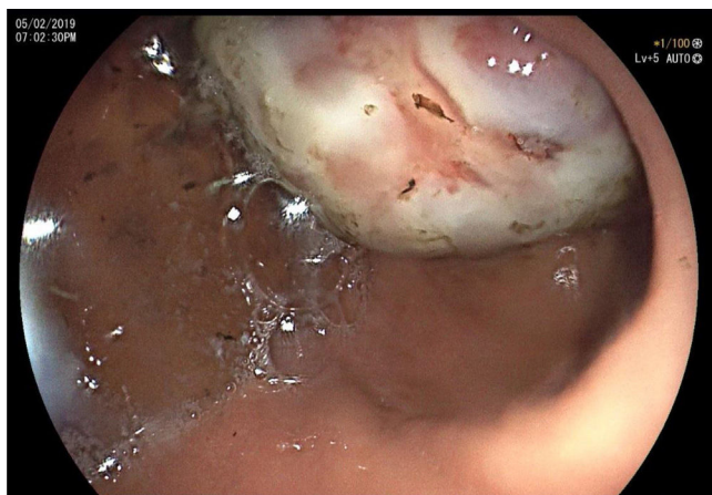
Figura 1 Imagen endoscópica en donde se observa tumoración en antro gástrico.

Departamento de Gastroenterología, Hospital Regional Valentín Gómez Farías ISSSTE, Zapopan, Jalisco, México