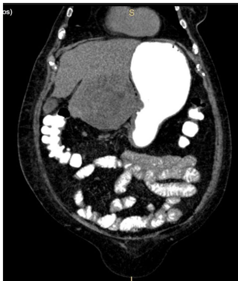
Figura 4 TAC abdominal en un corte coronal, en donde se muestra la tumoración hepática invadiendo el estómago.

diferenciales podía tratarse de un adenocarcinoma gástrico o tumor del estroma gastrointestinal (GIST). Este caso de hepatocarcinoma se presentó de manera infrecuente, en la literatura han sido reportados menos de 20 casos y su presentación más común es la hemorragia gastrointestinal.