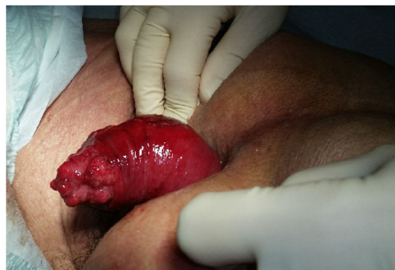
Figura 1 Prolapso rectal completo con un neoplasma polipoide irregular en el extremo distal.

La intususcepción del colon sigmoide que simula prolapso rectal es extremadamente raro en los adultos 1,2 . El presente caso es un ejemplo de la necesidad de considerar el cáncer colorrectal en una situación clínica de estas características 2,3 , y cómo un abordaje simple puede ser