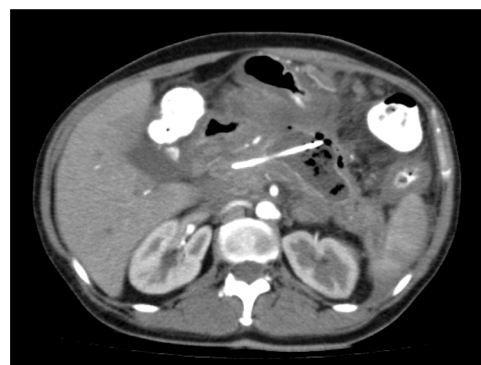
Figura 1 Tomografía abdominal previa a la intervención en múltiples cortes. Se aprecia colección pancreática necrosante encapsulada, con drenaje percutáneo con catéteres pigtail . Se documenta además interrupción abrupta del conducto de Wirsung por la presencia de colección pancreática.

En el momento de la valoración, la paciente tiene hospitalización prolongada, cursando diagnóstico reciente de diabetes mellitus de forma intrahospitalaria, requiriendo manejo con insulino terapia. Ha cursado con deterioro del cuadro clínico, hay síndrome de respuesta inflamatoria sistémica activa y está en tratamiento con antibiótico de amplio espectro, indicado por el Servicio de Infectología. Radiología Intervencionista decide realizar drenaje percutáneo de las lesiones descritas, obteniendo solo una mejoría parcial. La paciente presenta persistencia de drenaje sanguinopurulento en abundante cantidad (1.000 ml/24 h), por lo que se realiza Junta Médica entre los servicios de Cirugía Digestiva, Gastroenterología y Radiología Intervencionista, y aunque en la literatura existe ya evidencia de que el abordaje ideal para este tipo de casos es el realizado por vía ecoendoscópica, en su momento no se cuenta con la disponibilidad del recurso ni la experiencia institucional para su realización segura para la paciente. Se considera entonces realizar un abordaje percutáneo endoscópico que permita el desbridamiento del tejido necrótico como una alternativa al manejo convencional.