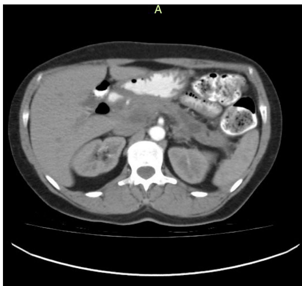
Figura 3 Tomografía abdominal de control con contraste 3 meses después del evento. Se aprecia una disminución del edema y el compromiso pancreático inflamatorio, con colección única residual sin signos radiológicos de sobreinfección asociada. En el momento de la toma, la paciente estaba completamente asintomática.