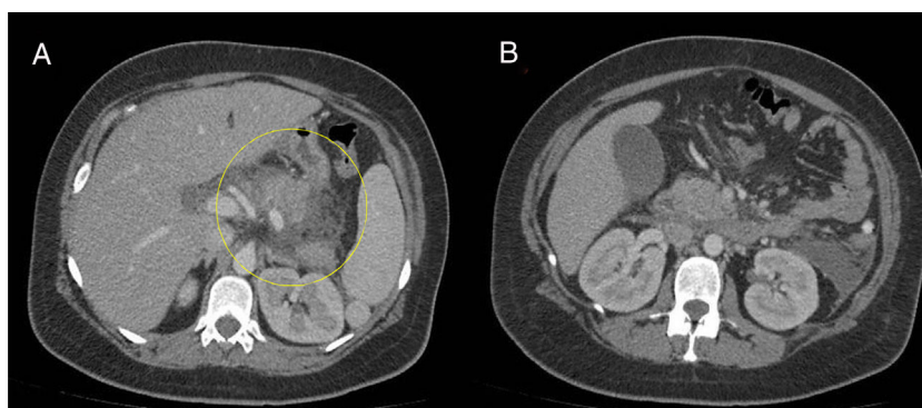
Figura 1 A y B) Se visualiza un páncreas edematoso sin necrosis rodeado por una colección líquida no encapsulada. Hígado, bazo y ambos riñones de tamaño y morfología normal. Vesícula de tamaño normal sin colecistitis ni evidencia de litiasis.