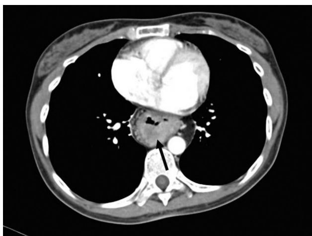
Figura 1 Tomografía computarizada de tórax que demuestra masa intraluminal en tubo gástrico interpuesto.

La paciente acudió nuevamente a nuestro instituto por padecimiento que inició en enero del 2016 con astenia, adinamia y melena. Se realizó una tomografía computarizada que mostró engrosamiento de la mucosa de la cámara gástrica intratorácica (fig. 1) y panendoscopia reportando esofagitis grave, estenosis parcial de la unión gastroesofágica y tumoración que abarca desde la curvatura mayor hasta antro con mucosa friable y pétrea. El reporte histopatológico de la biopsia fue adenocarcinoma gástrico tipo