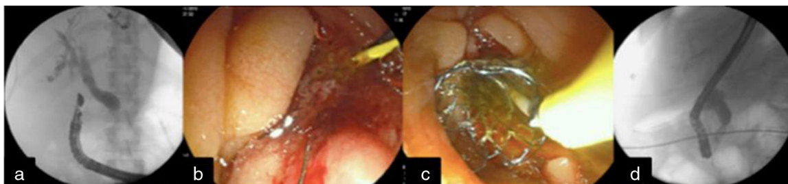
Figura 2 a) Punción guiada por el USE de la vía biliar con apoyo fluoroscópico y avance de guía hacia duodeno; b) Técnica de «Rendez-vous» y canulación de la vía biliar; c) Colocación de prótesis metálica biliar, y d) Visión fluoroscópica de la colocación de la endoprótesis biliar metálica autoexpandible.