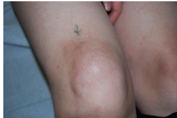
Figura 1 Zonas de empastamiento sobre rodilla derecha, eritematosas con aumento de temperatura local.

Presentamos el caso de una paciente de 48 años derivada por dolor, en ambas rodillas, de un mes de evolución. Entre sus antecedentes destaca hepatopatía por virus de la hepatitis C en tratamiento con triple terapia (telaprevir + interferón + ribavirina), la cual finalizó 2 meses previo al inicio de los síntomas. A la exploración física 2 zonas de empastamiento sobre rodilla derecha, eritematosas con aumento de temperatura local, sin lesiones en zona pretibial (fig. 1). En los estudios analíticos, parámetros normales (ANAS, FR, VSG y PCR, ECA discretamente elevada), así como Mantoux negativo, destacando en radiografía de tórax ensanchamiento discreto perihiliar, confirmándose en tomografía que además reportaba conglomerados adenopáticos perihiliares y mediastínicos. Pruebas de función respiratoria normal. Se realiza biopsia de lesiones nodulares reportando cambios compatibles con «sarcoidosis subcutánea» (fig. 2). Se decide seguimiento y observación con mejoría clínica y desaparición del cuadro 6 meses después. Se revisan todos los diagnósticos de sarcoidosis de la base de datos de nuestro hospital en los últimos 2 años, no encontrándose otro caso similar.