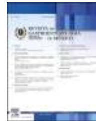
IMAGEN CLÍNICA EN GASTROENTEROLOGÍA