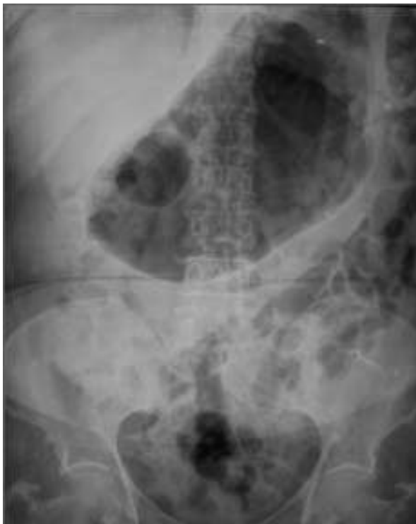
Figura 3 Radiografía complementaria del abdomen en donde se aprecia importante dilatación de la cámara gástrica, sin embargo el calibre de las asas intestinales y el grosor de las paredes es normal.

superior y traumatismos 1 . El presente caso trata de una paciente que desarrolló dilatación gástrica secundaria a traumatismo, lo cual según las teorías, se explica por una compresión del ganglio celiaco que provoca un reflejo inhibitorio vagal, condicionando así la dilatación de la cámara gástrica 2 .