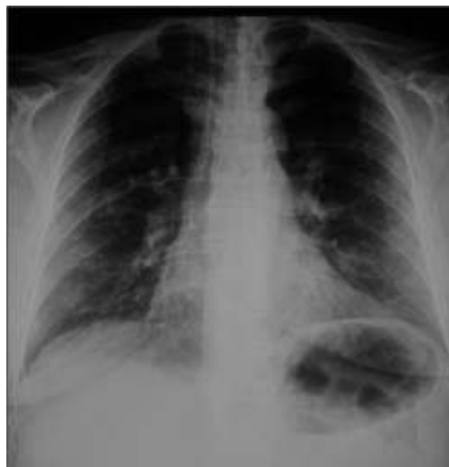
Figura 1 Radiografía de tórax inicial dentro de los parámetros normales.

Las causas de la dilatación gástrica se desconocen a ciencia cierta, se ha visto esta condición en casos de trastornos de la alimentación, vólvulo de hernia hiatal, anomalías electrolíticas, síndrome de la arteria mesentérica