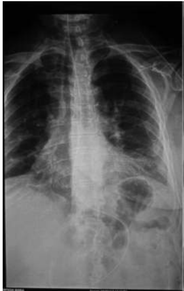
Figura 4 Estudio radiológico posterior a la colocación de sonda nasogástrica, que muestra normalización de las dimensiones gástricas.