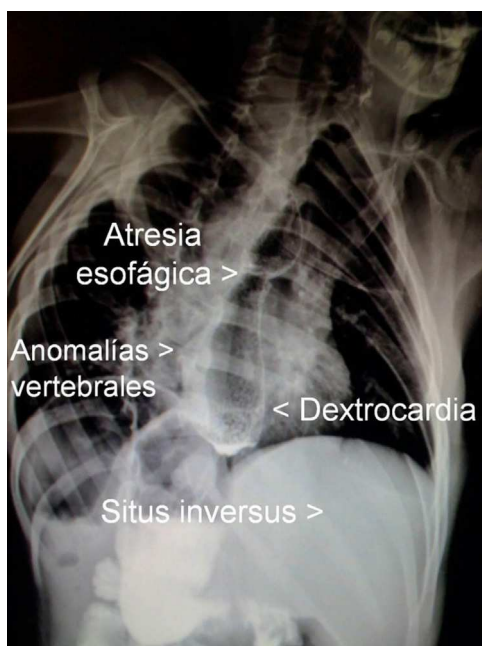
Figura 2 Radiografía de tórax y abdomen señalando las alteraciones encontradas en la asociación VACTERL.

—como malformaciones cardíacas severas— son manejadas quirúrgicamente, y en la segunda, el resto de las malformaciones continúan bajo control y rehabilitación a largo plazo (fig. 2).