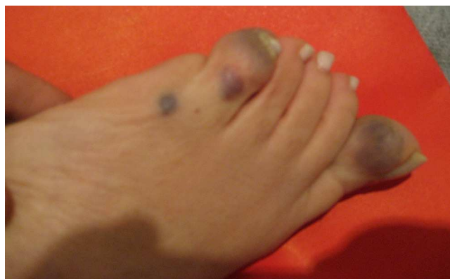
Figura 1 Lesiones redondeadas azuladas, que deforman un pie.

Estas eran redondeadas, azuladas, de consistencia gomosa, con un diámetro variable entre 1 y 3 cm e indoloras. Una de ellas deformaba un pie. Se realizaron videoendoscopias digestivas alta y baja. En la cara anterior del antro