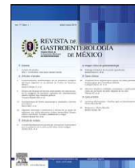
IMAGEN CLÍNICA EN GASTROENTEROLOGÍA