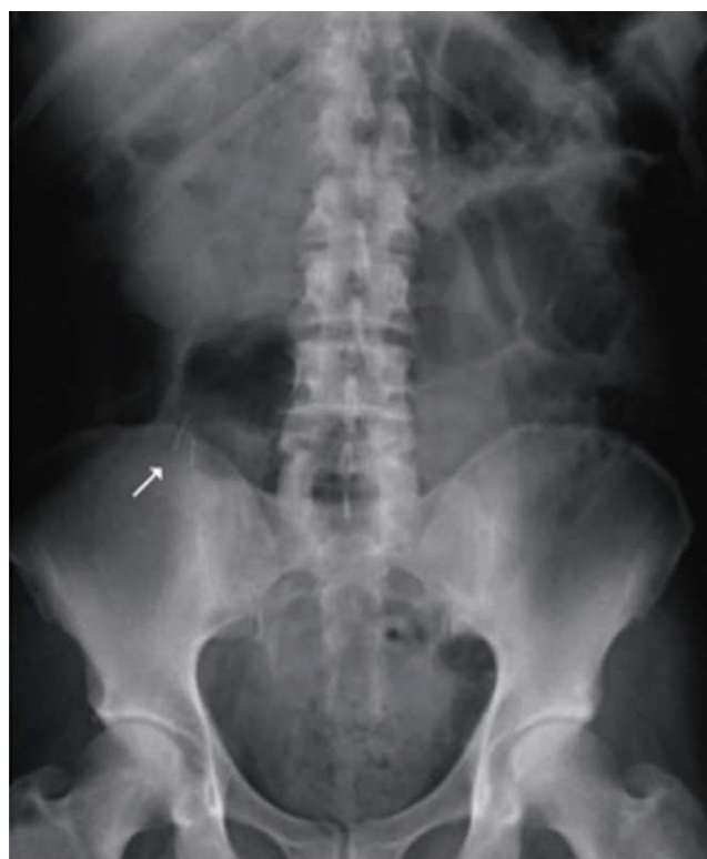
Figura 1 Radiografía AP de abdomen de paciente masculino de 66 años que muestra alfileres en la luz apendicular.

Paciente masculino de 66 años de edad, sin antecedentes de importancia, que ingresó al hospital con cuadro clínico de dolor abdominal de 36 h de evolución compatible con apendicitis aguda. Los laboratorios a su ingreso revelaron: 21,500 leucocitos/cc, neutrófilos 84.8%; el resto, normal. La placa simple de abdomen anteroposterior reveló la presencia de 2 objetos metálicos radiopacos, filiformes, puntiformes, de aproximadamente 5 cm, localizados en el cuadrante inferior derecho del abdomen (fig. 1). En el interrogatorio dirigido negó la ingesta de algún cuerpo extraño en los días o meses previos. Se estableció el diagnóstico de perforación intestinal secundaria a cuerpos extraños versus apendicitis secundaria a cuerpos extraños. Se realizó una laparotomía exploradora en la que se encontró un apéndice retrocecal de aproximadamente 9 cm, con perforación en su tercio medio, por donde protruía la punta de un alfiler, con el resto del cuerpo y un segundo alfiler dentro de la luz apendicular. Se le realizó una apendicectomía sin eventualidades. Se corroboró en el quirófano, mediante radiografía de la pieza, la presencia de ambos cuerpos extraños dentro de la luz apendicular (fig. 2). El reporte histológico de la