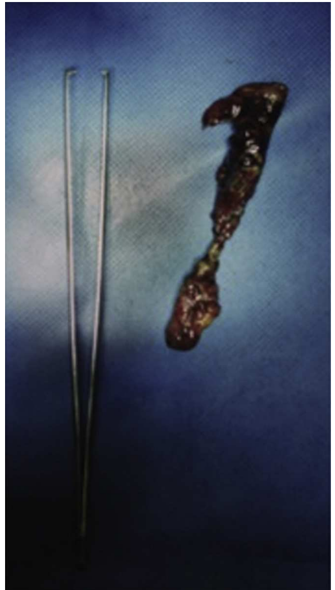
Figura 3 Apéndice cecal con peritonitis fibrinopurulenta y necrosis. Alfileres en su interior no mostrados.